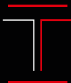
LIVE SUPPORT MANAGER